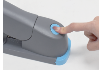
① 기기 상단의 파란색 철심밀대 버튼을 눌러줍니다.