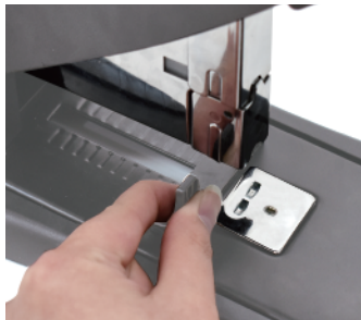
② 페이퍼가이드를 용지에 맞게 옮겨준 후 손을 놓으면 가이드가 고정됩니다.