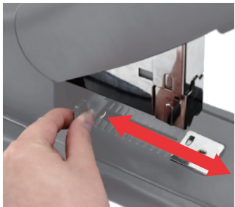
① 페이퍼 가이드를 잡아줍니다.