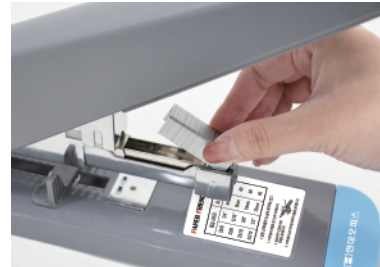
③ 철심밀대를 완전히 꺼내어 스테이플러 심을 교체해줍니다.