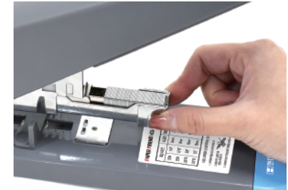
④ 철심 밀대를 다시 넣어줍니다.