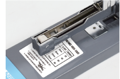
② 철심밀대 내부의 스프링이 작동하면서 밀대가 분리됩니다.